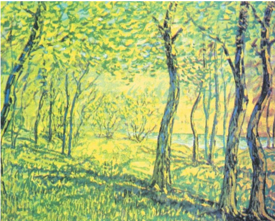
Зеленый шум. 1953 г.