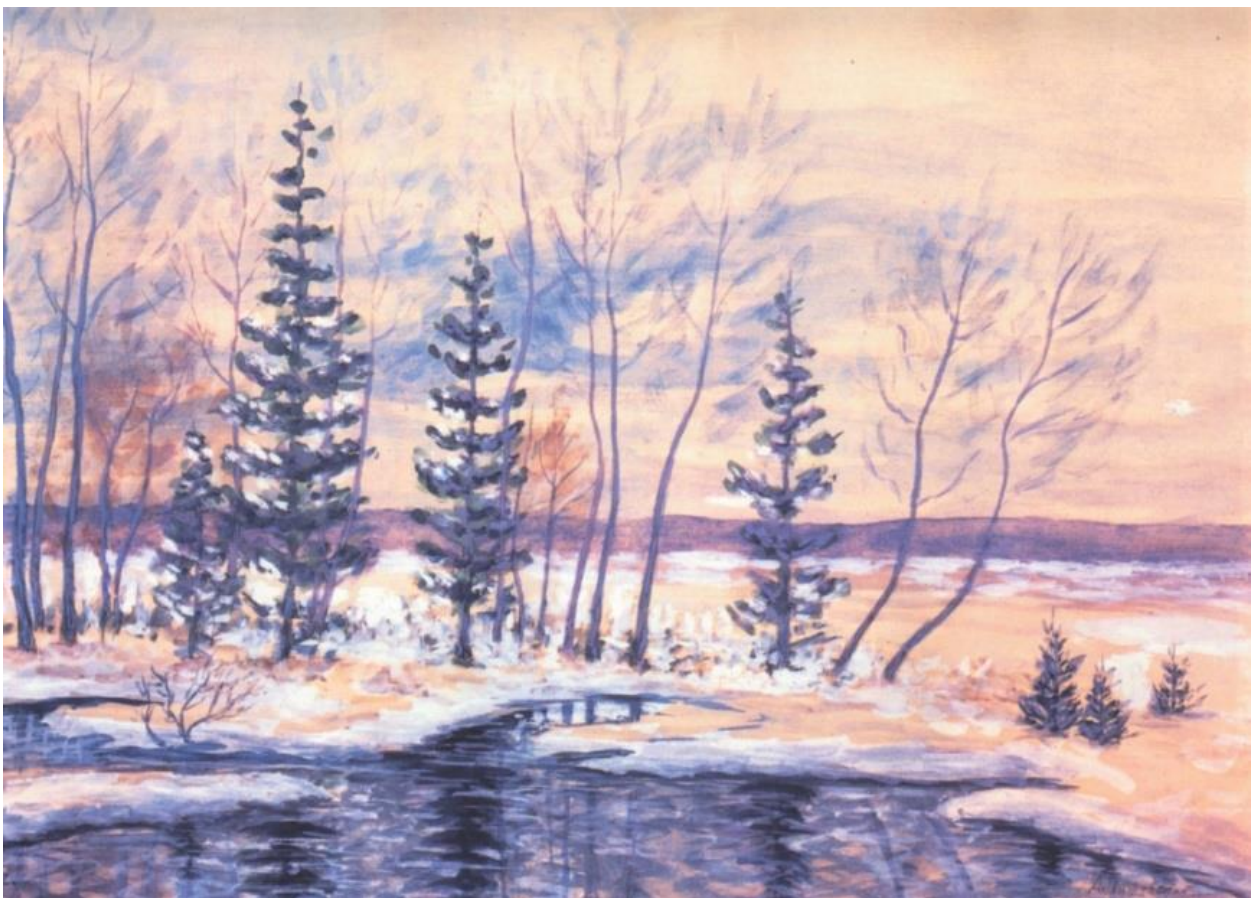
Холодная осень, первый снег. 1953г.