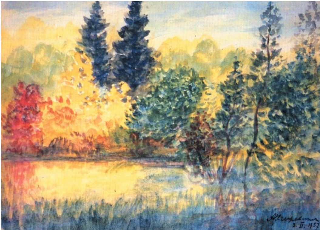
Приближается осень. 1957г.