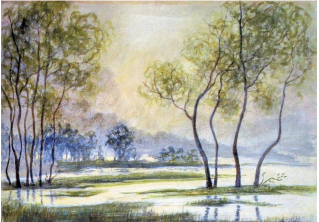
Дождливый день. 1947 г.