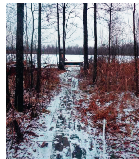
Гать от Таракановского шоссе к озеру Бездонному. 28 ноября 2014 г.

Проехав еще километров 15 по тому же Пятницкому шоссе, есть смысл посетить в деревне Исаково пока еще недостаточно известный храмовый комплекс, освященный во имя Алексея, Митрополита Московского, а также без преувеличения уникальный Музей Икон Божией Матери, коллекция которого насчитывает более 500 изображений Богоматери в возрастном диапазоне от XVII до XX веков, многие — в очень редких изводах. Храм известен многими чтимыми православными святынями, мощами прославленных святых. Храмовый комплекс и музей имеют свой сайт.