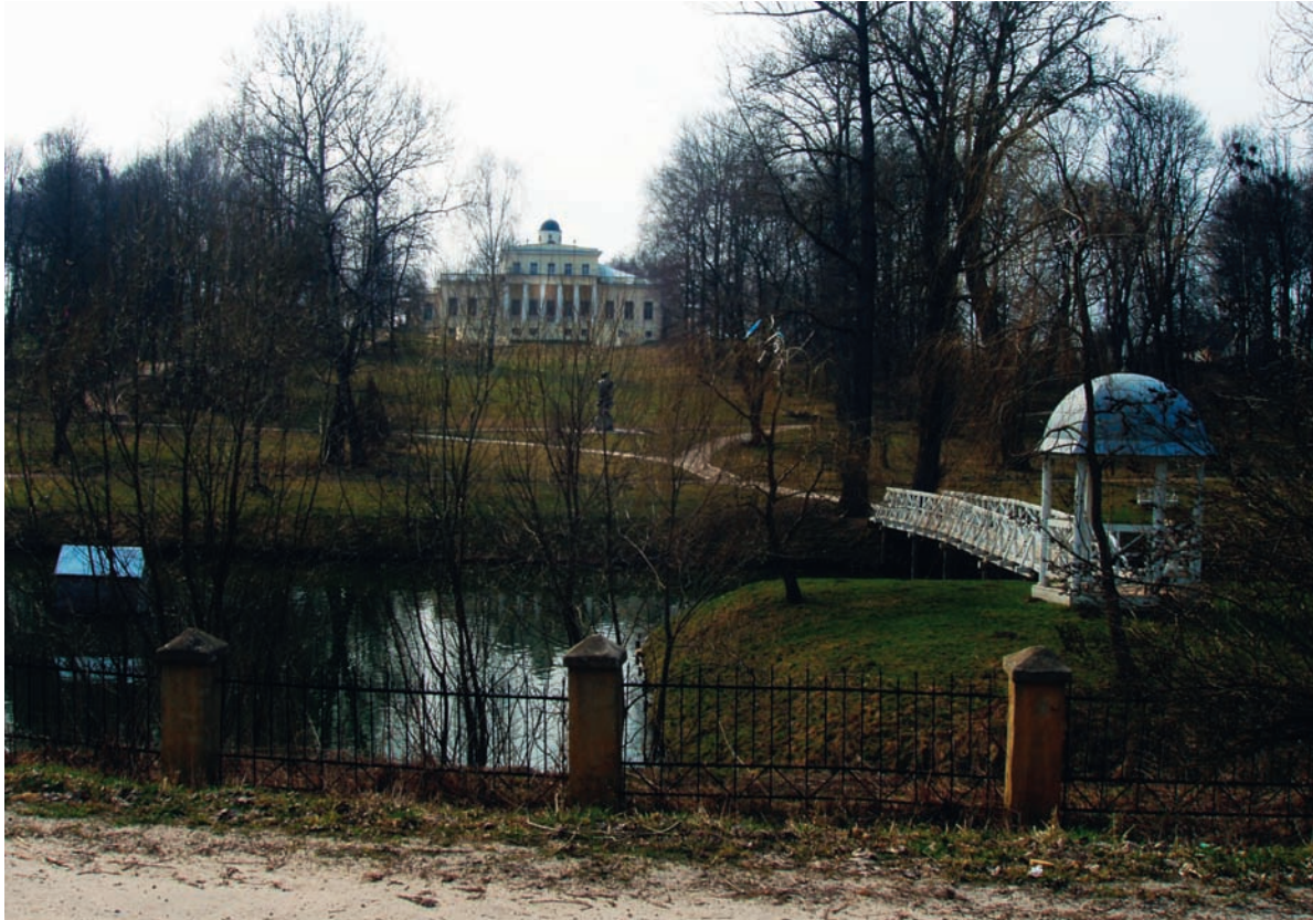
Родовая усадьба Тютчевых Овстуг (Жуковский район Брянской области), музей-усадьба Ф.И. Тютчева. Главный дом (восстановлен в 1986 г.)

Не то, что мните вы, природа: Не слепок, не бездушный лик — В ней есть душа, в ней есть свобода, В ней есть любовь, в ней есть язык... <1836>