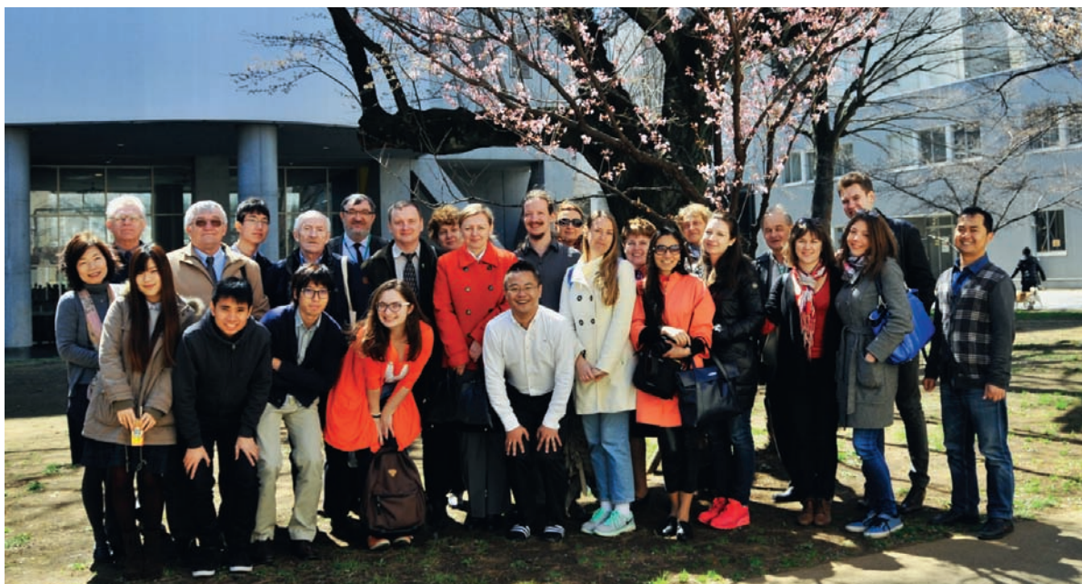
Участники Второго российско-японского семинара по устойчивости окружающей среды