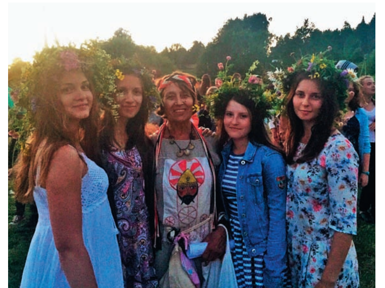
Русские красавицы — праздник Ивана Купалы