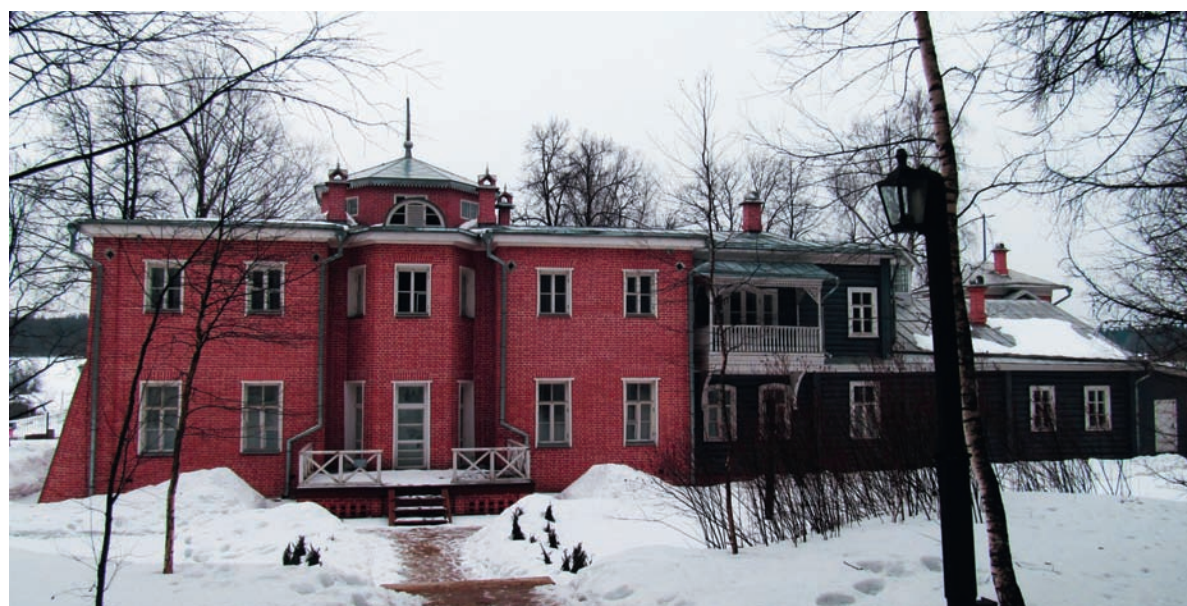
Музей-усадьба «Мураново» имени Ф.И. Тютчева. Главный усадебный дом (1842)

С горы скатившись, камень лег в долине. Как он упал? Никто не знает ныне — Сорвался ль он с вершины сам собой, Иль был низринут волею чужой? Столетье за столетьем пронеслось: Никто еще не разрешил вопроса. 15 января 1833; 2 апреля 1857