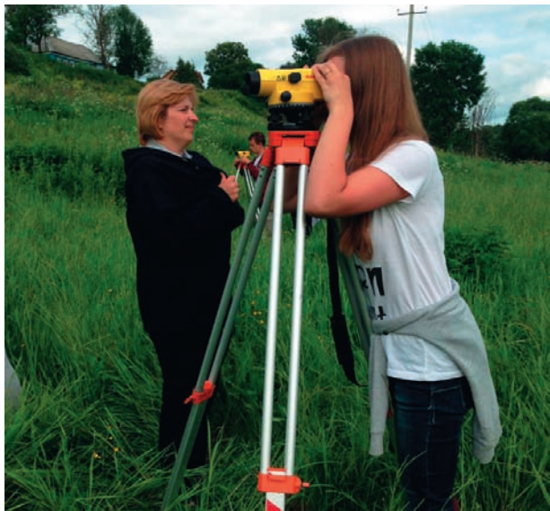
Практика по топографии — самая инструментально сложная

Стоит ли говорить, что для выпускников географического факультета база в Сатино, территория полигона практики, пойма р. Протвы становятся объектами поклонения и местом ежегодного паломничества. К сожалению, уже на протяжении нескольких лет мы наблюдаем процесс сокращения площадей, пригодных для проведения полевых маршрутов и других работ, необходимых для выработки базовых географических навыков. Давно уже огорожены и застроены значительные площади на правом берегу Протвы — непосредственно примыкающие к Сатино с востока и юга. На смену разгульным полям на междуречье в окрестностях Дедюевки и Рыжково скоро также придут заборы коттеджных поселков. Тем не менее остается надежда, что процесс перевода сельскохозяйственных земель в земли жилого фонда в некоторый момент прекратится, что останутся относительно нетронуты Антоновская балка и верховья Волчьего оврага, Мамаева круча, Барский луг и окрестности Рыжковской излучины — урочище Полднище, Серебряный луг и, конечно, Ветлы.