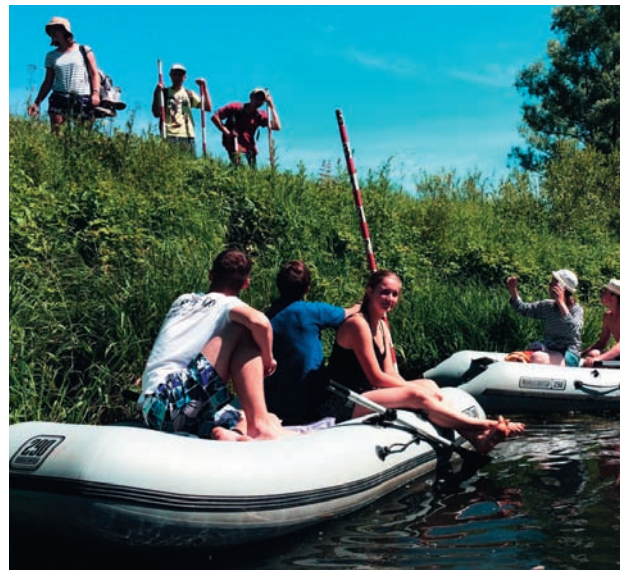
Широка река, глубока река... — Гидрологические измерения на р. Протве