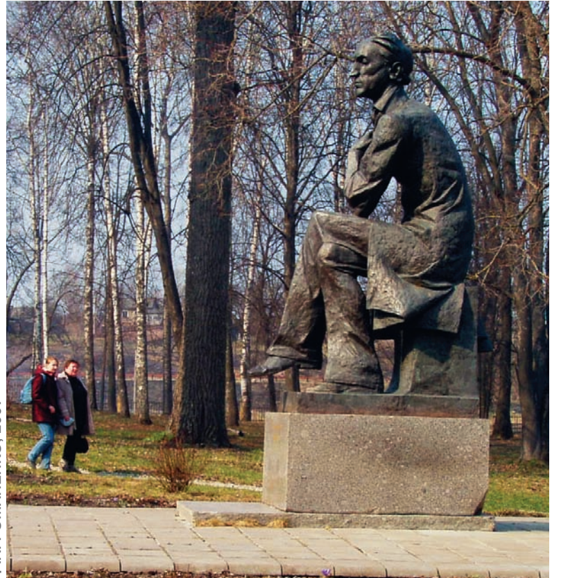
Ф.А. РОМАНЕНКО, 2007

Эти бедные селенья, Эта скучная природа — Край родной долготерпенья, Край ты русского народа!