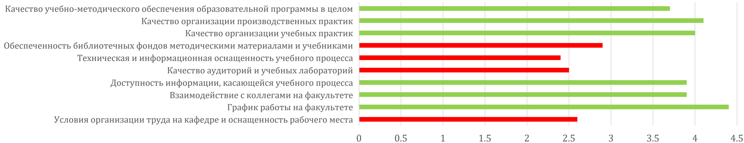
Насколько высоко по 5-балльной шкале преподавателя оценивают:

■ скорее да, чем нет ■ скорее нет, чем да ■ нет