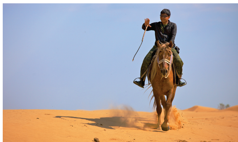
Чабан (пастух), Астраханская область. Недавно он вернулся из армии и сразу решил поселиться у дяди в степи. Всего за полгода, помогая дяде управлять с большими стадами коров, баранов, верблюдов, успел завести и собственный небольшой табун лошадей