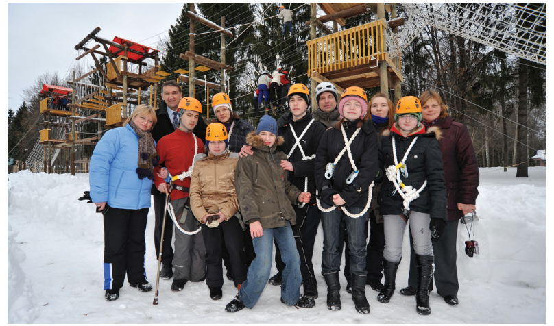
Тренировка в г. Руза, Московская обл.

— От нашего Клуба отпочковалась организация — Центр дополнительного образования «Лаборатория путешествий». Это государственное образовательное учреждение в структуре Департамента образования города Москвы. Педагоги