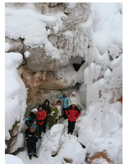
У водопада «Святой источник» // Фото Ксении БИЛЕНКИНОЙ

Впечатляет здешний музей, особенно коллекция косторезной мастерской, тоже, кстати, носящей имя и фамилию Ломоносова. Чтут здесь своего земляка, даже щит на въезде в Холмогоры поставили к его 300-летию.