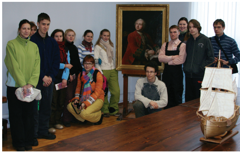
В краеведческом музее Архангельска

Архангельская область богата сказочниками. Наверно, самый известный из них — Степан Григорьевич Писахов. В Архангельске даже есть музей, посвященный этому уникальному человеку, который был и художником, и писателем, и этнографом, и сочинителем сказок... Вот что он писал в одной из сказок об основании Архангельска: «Раньше стоял один столб, на столбе —