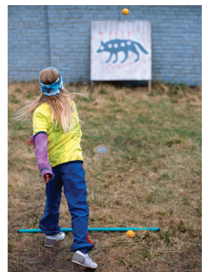
Праздник «Саамские игры» на Кольском полуострове, село Ловозеро. Девочка участвует в соревновании по метанию мяча. Раньше в нарисованного волка метали копье и стреляли из лука. Сегодня, в более современном варианте, кидают маленький мяч, имитирующий камень

Первое время вы будете сильно уставать, и, возможно, вам покажется, что из всей съемки нет ни одного удачного кадра. Так вам будет казаться еще долгое время, пока совершенно случайно вы не увидите «свой» кадр, который перевернет все отношение к собственным