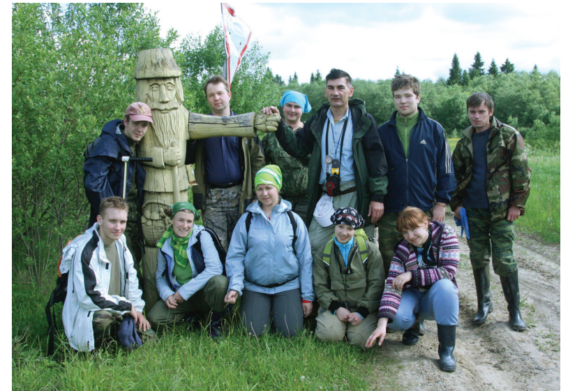
В заповеднике «Кологривский лес»

Однажды утром за нами приехал гусеничный вездеход: чего только не придумают русские, чтобы не строить дороги! В центре заповедника это единственное