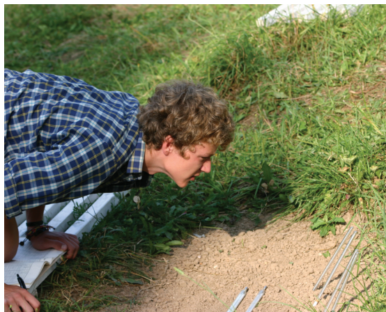
Практика по метеорологии и климатологии, Сатинская УНБ 5