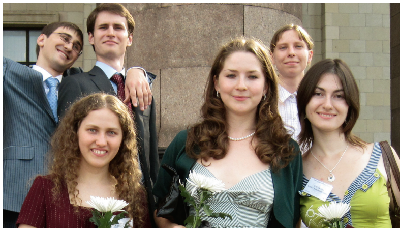
Выпуск 2010 года