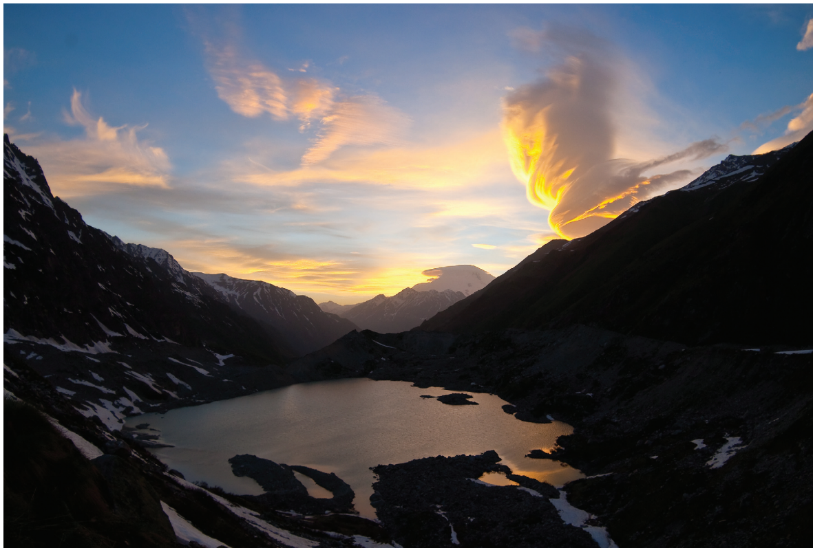
↑ Озеро Башкара, долина Адыл-Су, Приэльбрусье