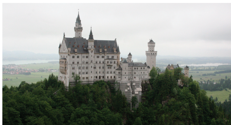
Замок Нойшванштайн — самый посещаемый замок Баварии

Следующей остановкой был Инсбрук — центр федеральной земли Тироль, милый городок с очаровательным центром, настоящая альпийская «деревня». Кстати, город является центром горнолыжного и бобслейного