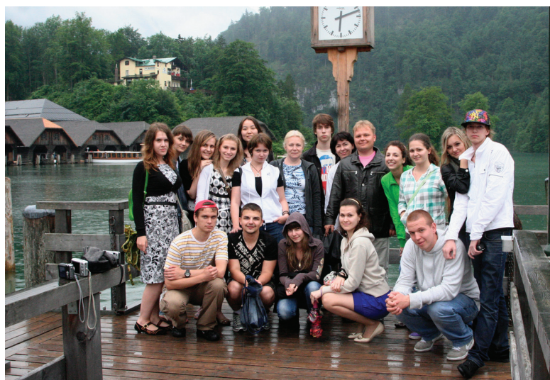
На озере Кенигзее

Мы посетили Новую Пинакотеку, знаменитую коллекцией работ импрессионистов. Студентам, как не очень большим ценителям и специалистам в искусстве, очень понравилось то, что в галерее представлены работы большого количества художников и направлений, а число картин не превышает грани разумного. Здесь спокойно и с удовольствием можно смотреть представленные