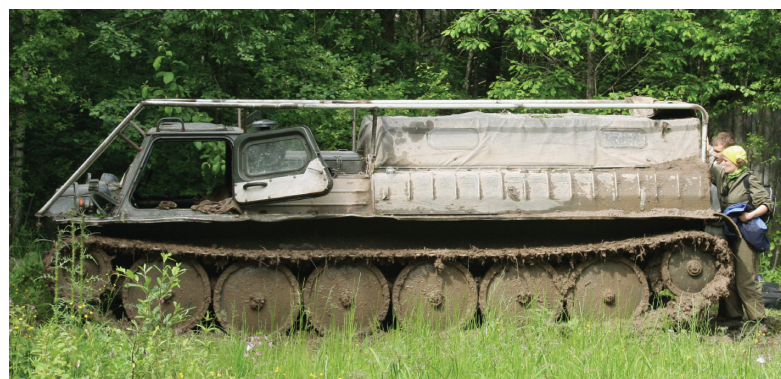
В центральной части заповедника гусеничный вездеход — единственное средство передвижения

От редакции: Поздравляем сотрудников и учащихся с юбилеем кафедры физической географии и ландшафтоведения! В следующем номере «Географ'а» читайте интервью с заведующим кафедрой, профессором, членом-корреспондентом РАН К.Н. Дьяконовым. g