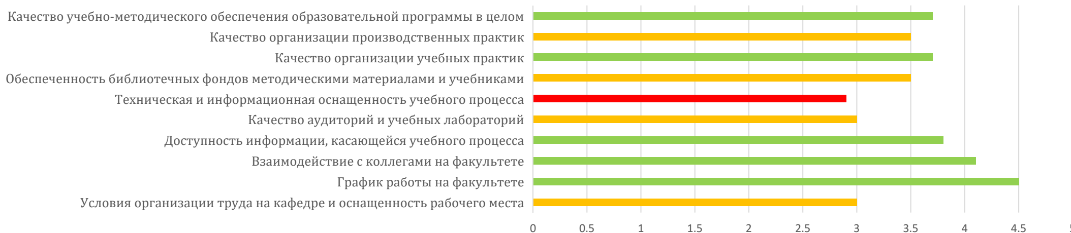
Насколько высоко по 5-балльной шкале преподавателя оценивают: