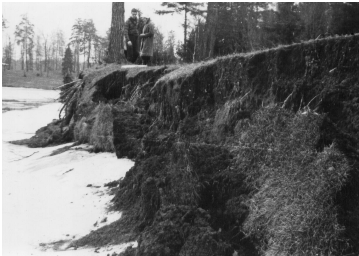
Клиф берегового стационара на Пироговском водохранилище